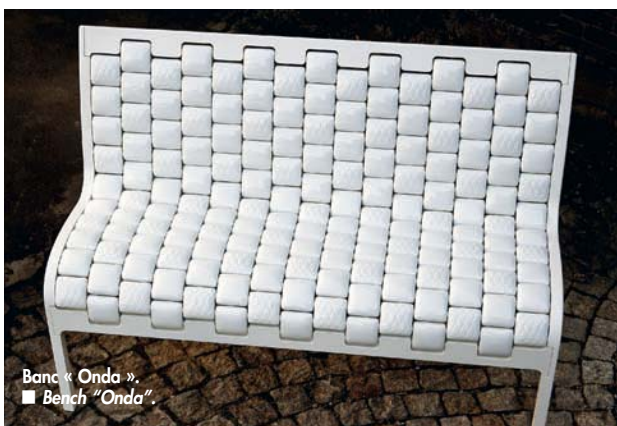
Banc « Onda ». ■ Bench "Onda".