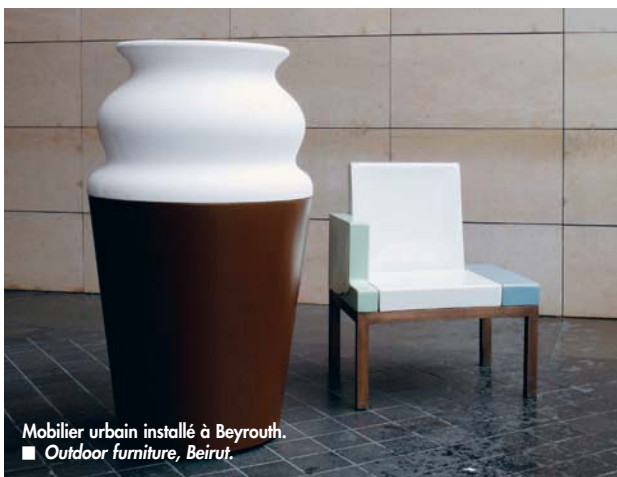
Mobilier urbain installé à Beyrouth. ■ Outdoor furniture, Beirut.

territoire urbain, plus riches, plus sophistiquées. Les projets offrant cette liberté restent rares, c'est pour cela que j'essaie de plus en plus de les provoquer, voire d'en être l'initiateur.