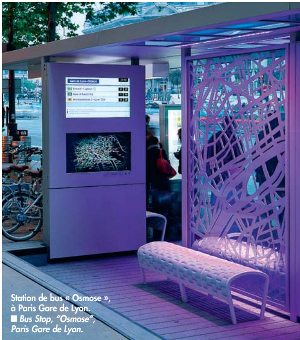
Station de bus « Osmose », à Paris Gare de Lyon. ■ Bus Stop, "Osmose", Paris Gare de Lyon.