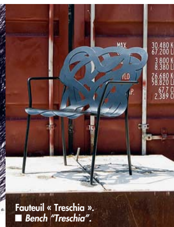
Fauteuil « Treschia ». ■ Bench "Treschia".

D. I. Today, you design lighting and outdoor furniture; your urban furniture adorns the streets of Beirut, Marseille and Lyon; you develop public spaces, you provide