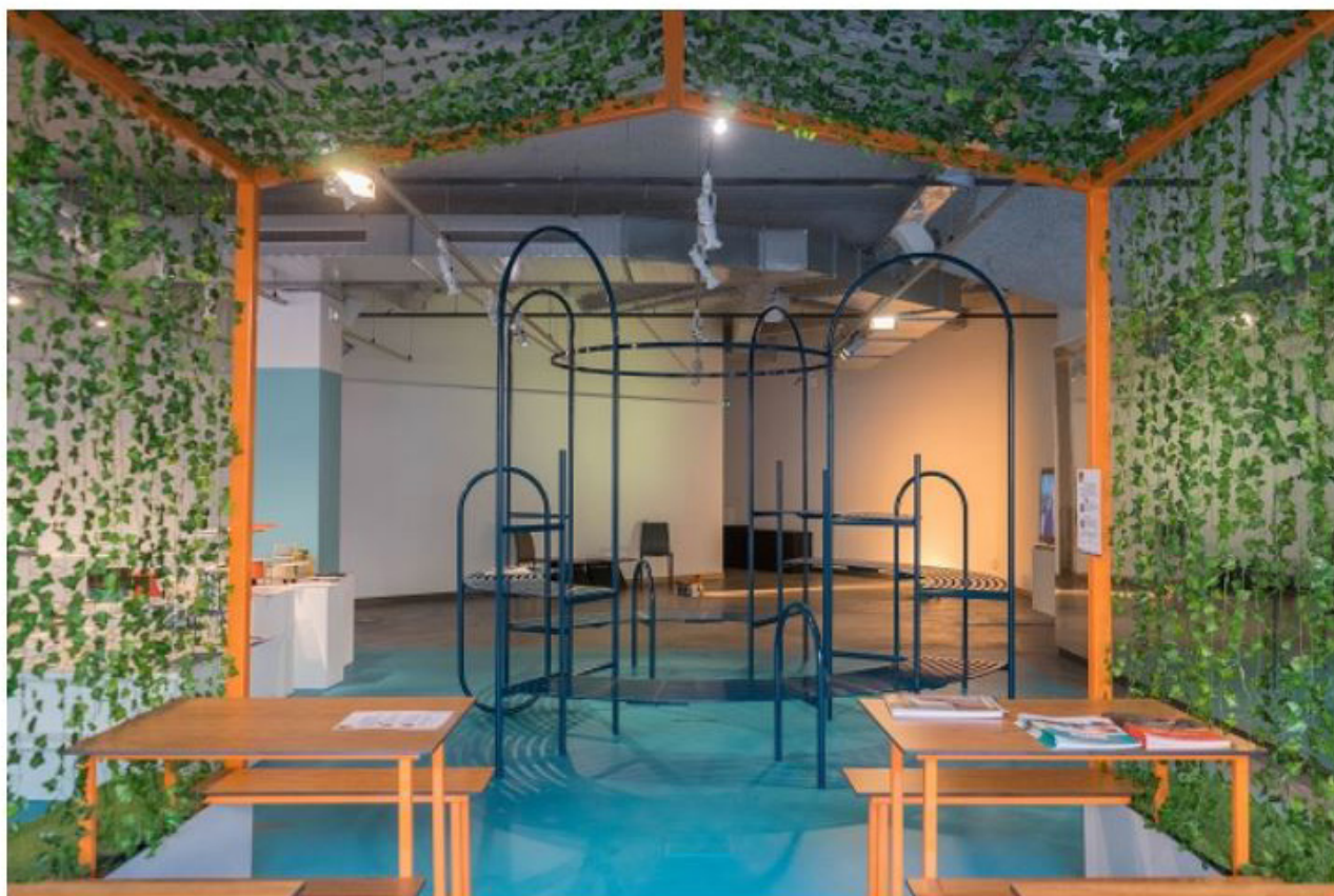
Exposition Dehors, la ville de demain, VIA.

adhérents du groupement Mobilier urbain de l' Ameublement français, le VIA a réuni des propositions et concepts de mobilier innovants qui invitent à changer le regard sur la ville, et à la réinventer. Elles prennent la forme de réalisations d'industriels, de projets de designers ou d'étudiants, de prototypes, dans une scénographie signée Caterina et Marc Aurèle (du studio Aurel design urbain).